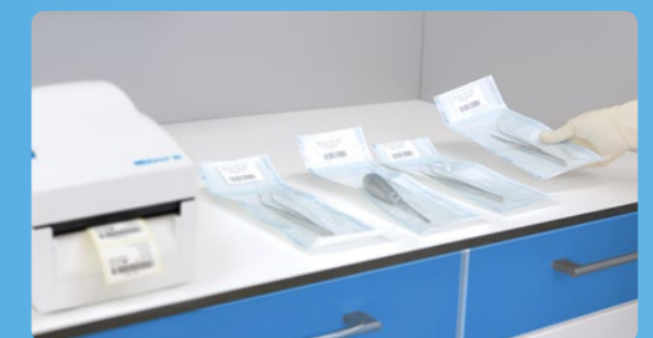
✔ Identificazione con MELAprint 80