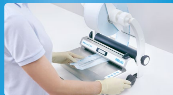
✔ Imballaggio con MELAseal o MELAstore