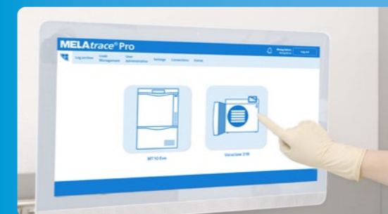
✔ Documentazione e rilascio con MELAtrace