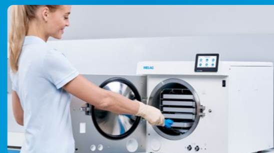
✔ Sterilizzazione a vapore con Vacuclave