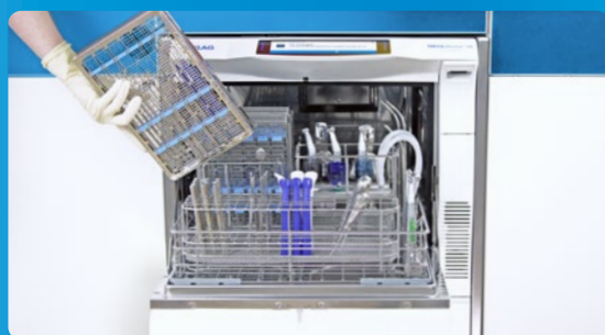
✔ pulizia e disinfezione con MELAtherm